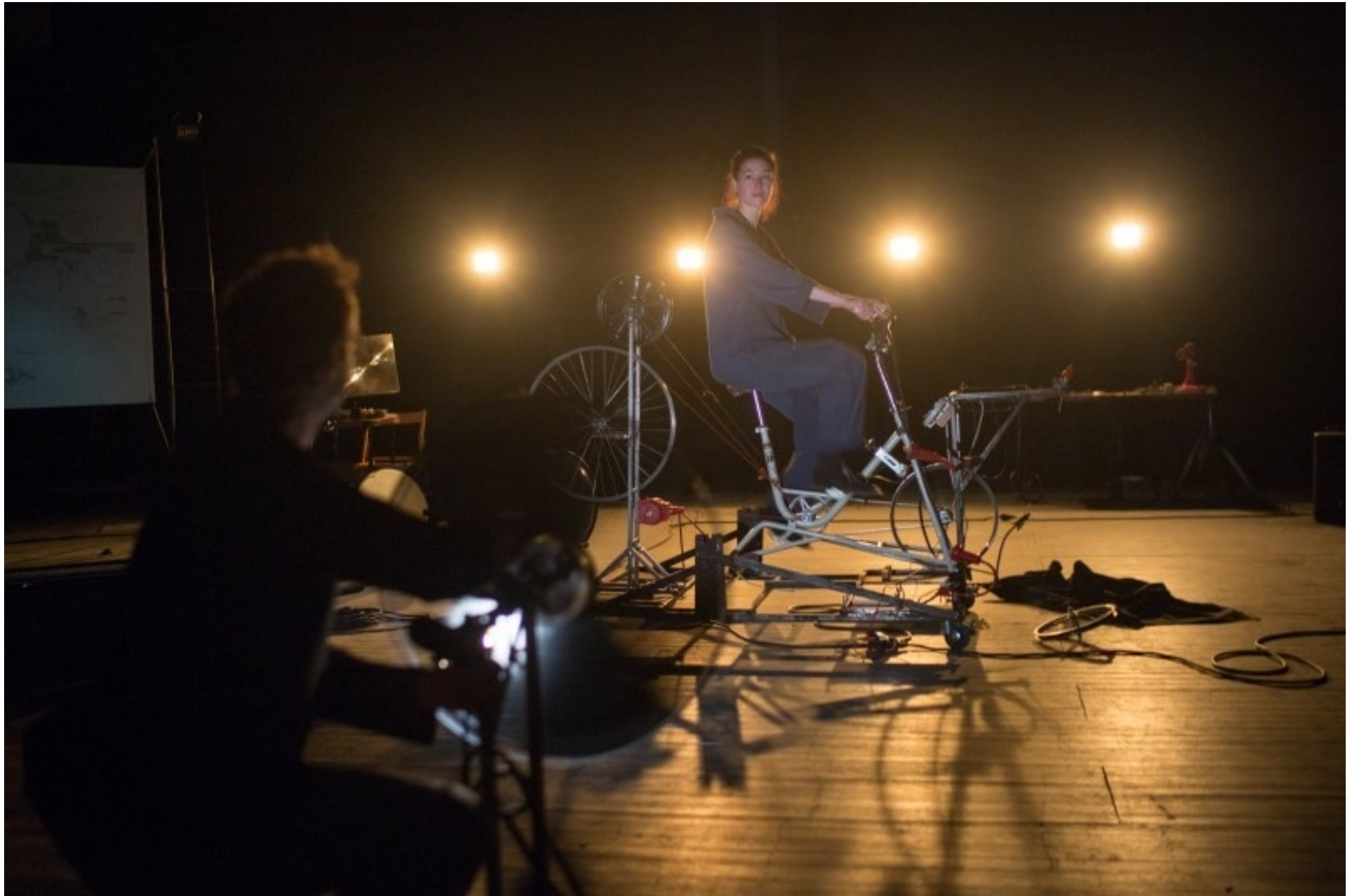
Le système au premier plan est « l'Eclipse », nommé dans l'extrait ci-dessous