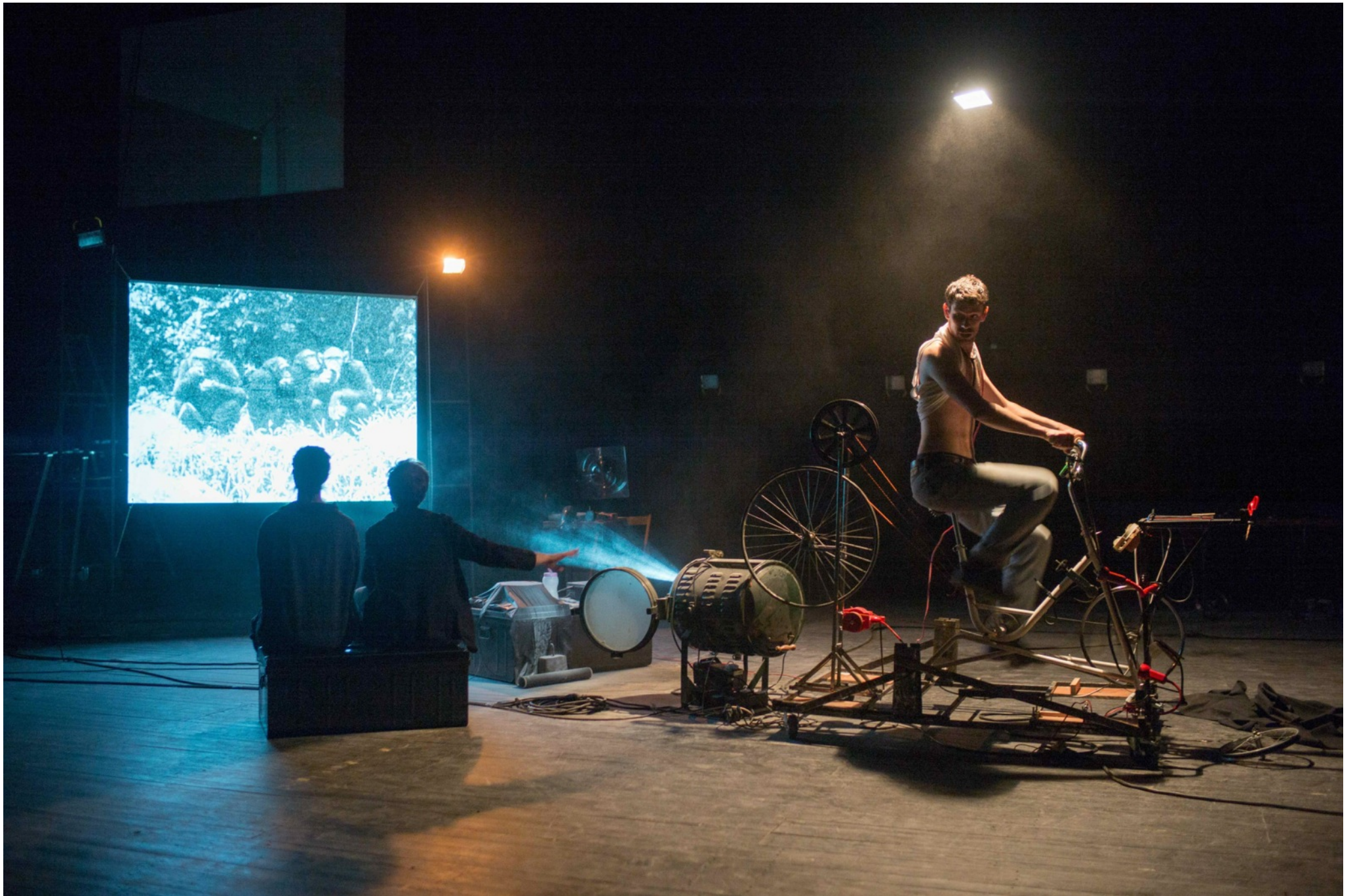
lors de notre passage au Cube (juin 2018)